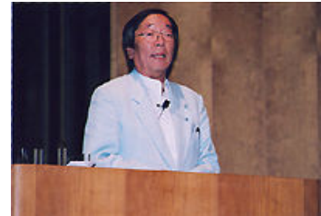
El Sr. Masaru Emoto dando una charla donde enfatiza que “El poder del espíritu de las palabras salvará el planeta Tierra. Vamos proteger el mundo de agua a través del amor y del agradecimiento”.